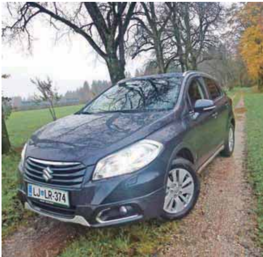
Asfalta nikoli ne pogreša.