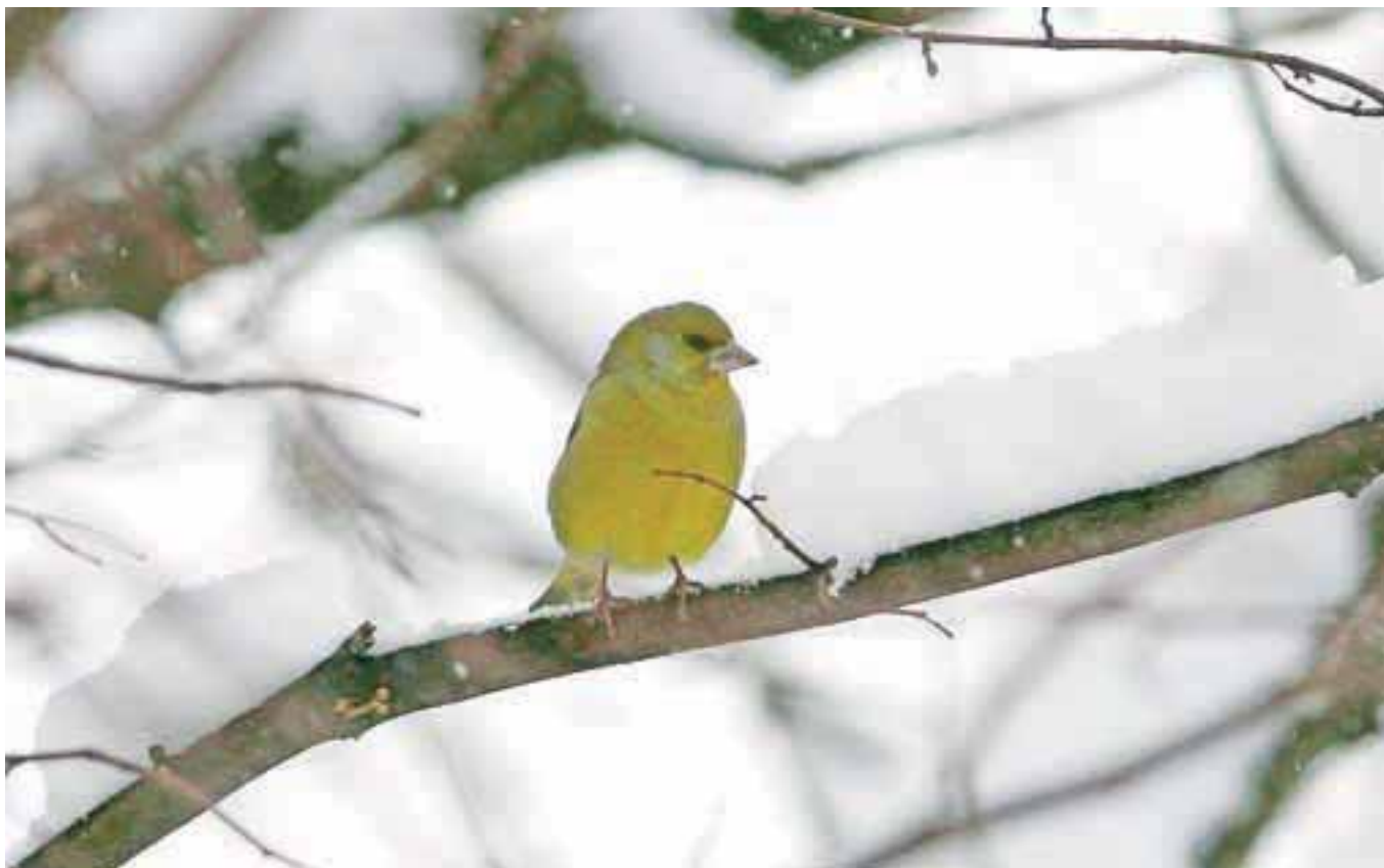
Takšna je zimska idila na posestvu Brdo pri Kranju, ko zapade sneg.

fantazijske umetnine. V nekdanji grajski pristavi Zois bodo na ogled božične dekoracije, zunanje dogajanje pred Zoisovo pristavo bodo popestrili kulinarični mojstri posestva, ki bodo klesali ledene skulpture v živo. S pridihom viteške veličine boste vstopili v pridih nekega drugega časa in dogodivščin Viteza Gašperja Lambergarja res ne gre zamuditi. Vse skupaj bo prežeto s tradicijo in