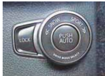
Čudežni gumb, ki spreminja avtov karakter.

sti in poslovni čas. S tem avtom prideš kamorkoli pelje cesta, pa naj bo asfaltna ali makadamska ali pa le potka. Takega plezalca boste v tem razredu težko našli. Hkrati pa boste tudi z lupo iskali tako ekonomičnega in udobnega. Avto vam na armaturi celo sam predlaga, v kateri prestavi je vožnja najbolj ekonomična.