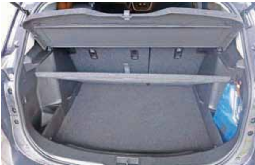
Dvojno dno spremeni mnenje o prostornosti.

Največji prtljažni prostor v svojem razredu, ki mu lahko s pomočjo številnih dodatkov še povečate uporabnost. Sredinsko postavljen informacijski zaslon nudi vozniku odličen pregled nad številnimi podatki o vožnji in stanju vozila. Med drugim svetuje vozniku tudi prestavo, v kateri bo vožnja najbolj varčna glede na razpoložljive vozne parametre. Dvopodročna avtomatska klimatska naprava pooseblja udobje, saj omogoča vozniku in sovozniku ločeno izbiro zaželenih temperature v avtu. Visokosvetilni HID prednji žarometi (Xenon) z energij-