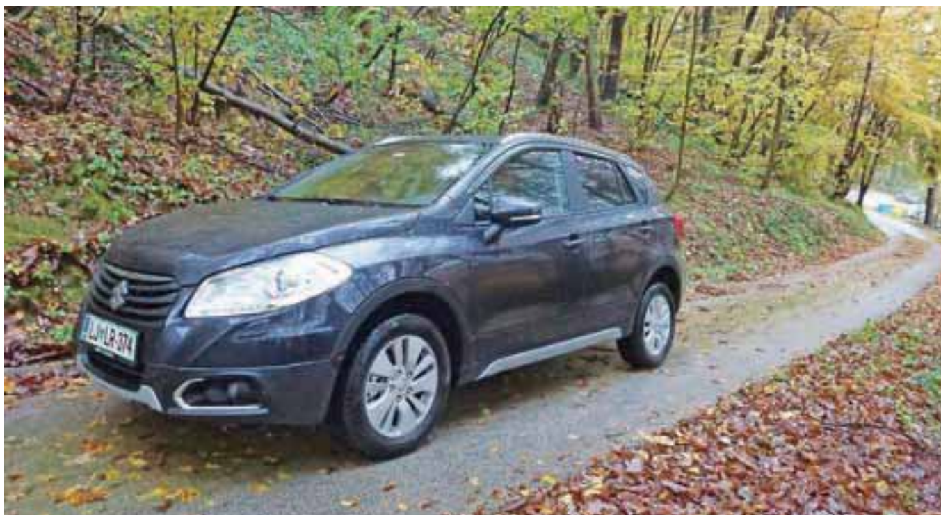
Suzuki SX4 S-cross

Pri Suzukiju vedo, kaj radi vozijo nezahtevni in zelo zahtevni vozniki.