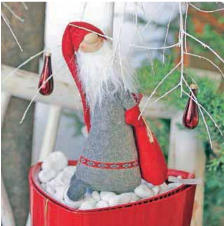
In ja, Božiček je prišepnil, da tudi pride. Pravi, seveda.

ustvarjalnostjo, tako bodo v sodelovanju z različnimi rokodelci in društvi pripravili razstavno-prodajni kotiček unikatnih izdelkov domače in umetnostne obrti. Morda dobite idejo za praznična darila. Vse dni bo dišalo po dobrotah na brdskem prazničnem sejmu, kjer bodo na voljo brdske delikatese in domači napitki. Prav poseben del kulinarčne zgodbe bo Brdska prodajalnica, kjer boste poskušali Okuse Brda in kakšno dobroto odnesli tudi domov.